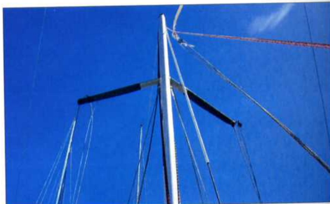
▲ Ce qui reste de notre mât une fois arrivé aux Antilles. Il est tenu par ses bas-haubans et par l'étau de fortune que nous avons gréé.