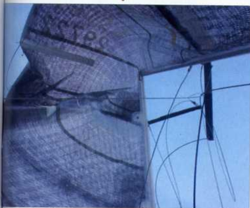
▲ Vision d'horreur : le mât a cassé net, entre les deux barres de flèche.