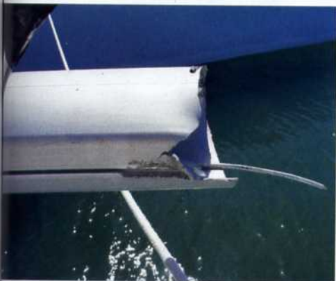
▲ La cassure est franche. La gorge est amochée : nous avons joué du tournevis pour libérer la GV.

certains de pouvoir faire un gréement de fortune avec le demi-mât emplanté sur la quille qui tenait par les bas-haubans. Nous avons encore assez de gasoil pour recharger les batteries, ainsi que de l'eau et à manger en bonne quantité.